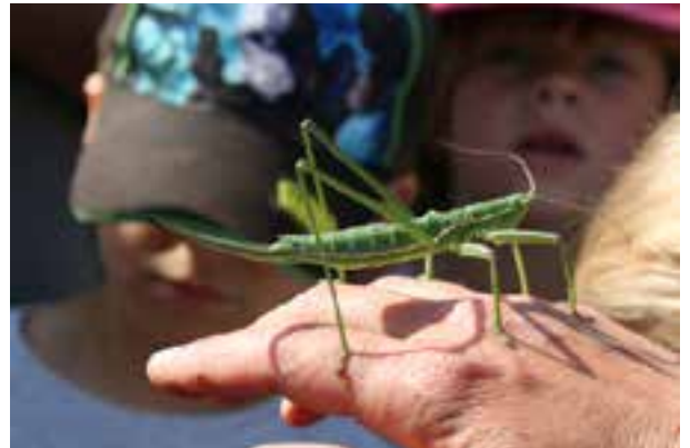
Animations ENS