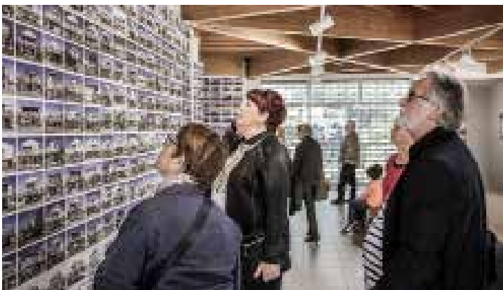
Exposition sur les Chalets de Gruissan chez «Poulet de Gruissan»