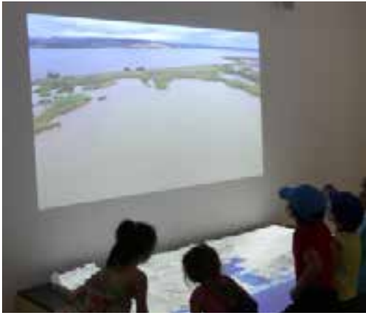
Maquette 3D Maison de la Clape