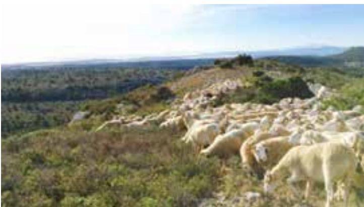
Troupeau dans la Clape