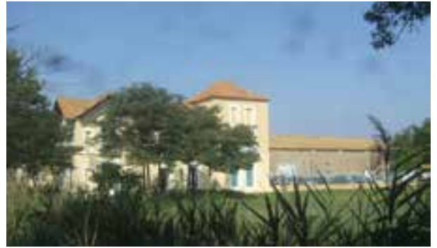
Domaine du Grand Castelou