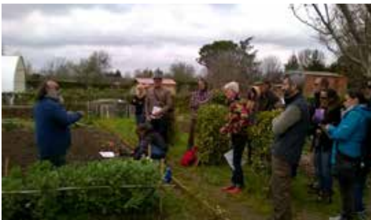
Formation jardinage- Ecohabitons le Parc