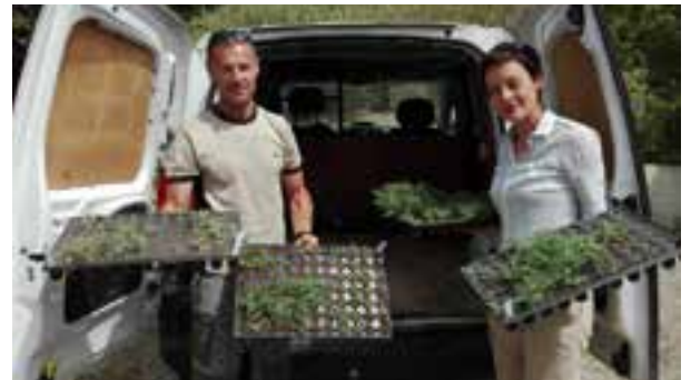
Transport des plans de Centaurées