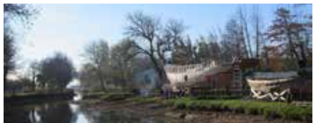
Chantier de charpenterie